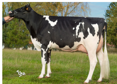
Mère : ROC HIPPIE