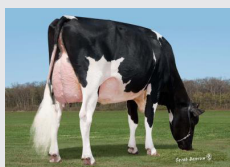
AGM : SHNAZZY RAE - USA