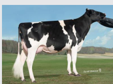
GM : SIZZLE RAE - USA