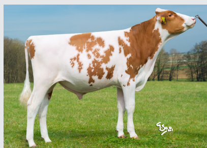
LEBREK RED H2E