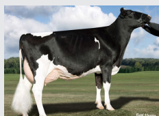
AAGM : DISH RAE - USA