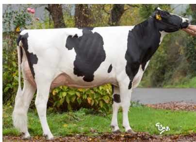
Tante : IGULA EARL LAND CREST - 56