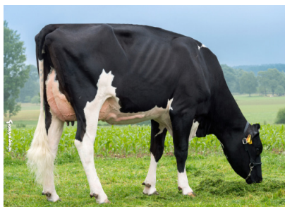
Tante : ISCELA EARL LAND CREST - 56